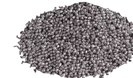
Granalla de acero esférica