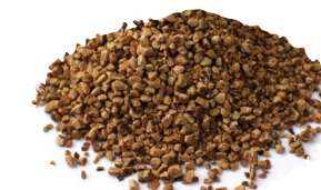
Cáscara de nuez