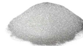
Perla de vidrio