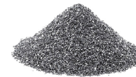
Granalla de acero angular