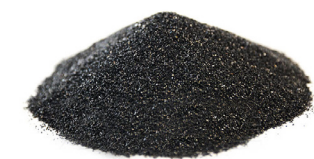
Escoria de cobre