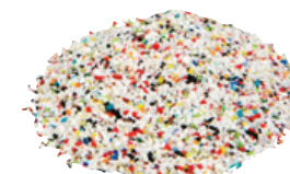
Abrasivo plástico (media plástica)