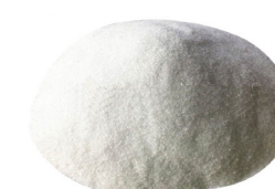
Bicarbonato de sodio