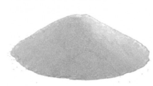
Óxido de aluminio