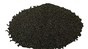
Carburo de Silicio